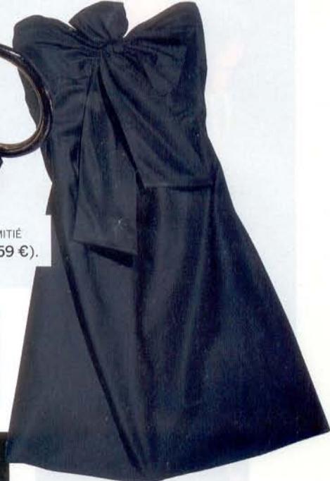
LOUIS VUITTON (450 €).