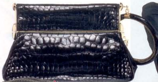
DIOR (10.000 € aprox.)