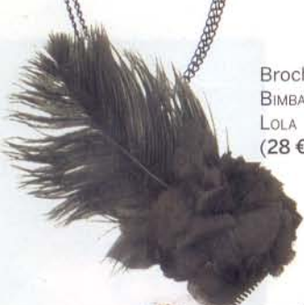
Broche BIMBA & LOLA (28 €).