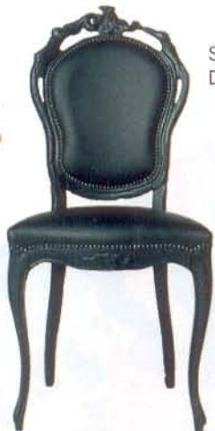
Silla Smoke Dining, Moooi.