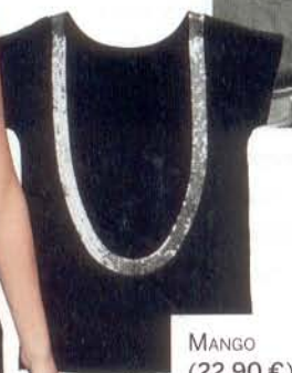
MANGO (22,90 €).

¿Igualdad? No, gracias. Ellas hacen realidad sus ganas de invertir los roles, imponiendo de paso su estilo. Lo tienen todo, y quieren más. Joyas, lujo y sofisticación. De Garbo (en la foto) a Madonna, su ambición cotiza al alza en las pasarelas.