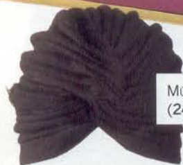
MÜHLBAUER (240 €).